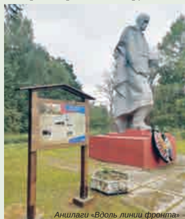
Аншлаги «Вдоль линии фронта»