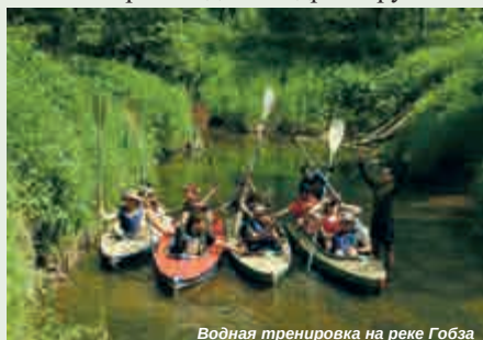
Водная тренировка на реке Гобза

Начало лета 2021 года ознаменовалось комбинированным походом по реке Гобзе. Прохождение маршрута осуществлялось двумя группами. Изначально предполагалось, что первая группа на байдарках пройдёт участок Гобзы от деревни Буризи до стоянки «У ляды», где передаст эстафету второй группе, путь которой по реке закончился бы в районе урочища Кошелёво. Но жаркое сухое лето внесло свои корректировки в планы гамаюновцев. Гобза обмелела за эти дни так, что вторая группа довольствовалась лишь тренировкой по расчистке русла реки и протаскиванию байдарок по перекатам. А ведь это один из участков водного торгового пути «Из варяг – в греки»... Само слово «Гобза» происходит от древнерусского «гобзь» - «богатство».