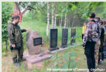
На мемориале «Память сердца»

гранта Министерства просвещения на мемориале были установлены гранитные плиты с именами юных партизан, информационный щит, бетонные ступеньки, высажены культурные растения. Работы проводились при поддержке Национального