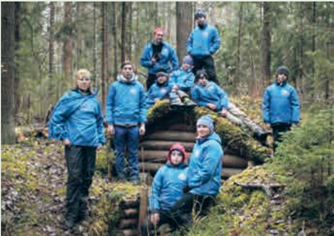
Участники экспедиции у «Партизанских землянок»

В ноябре 2020 года исследовательская группа подробно изучила