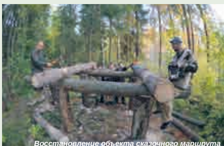
Восстановление объекта сказочного маршрута

Но не только археологические древности и сказочные строения встречаются в густых Рибшевских лесах ребятам. На реках Желуховка, Лабиринт, Василевка, у бывших населённых