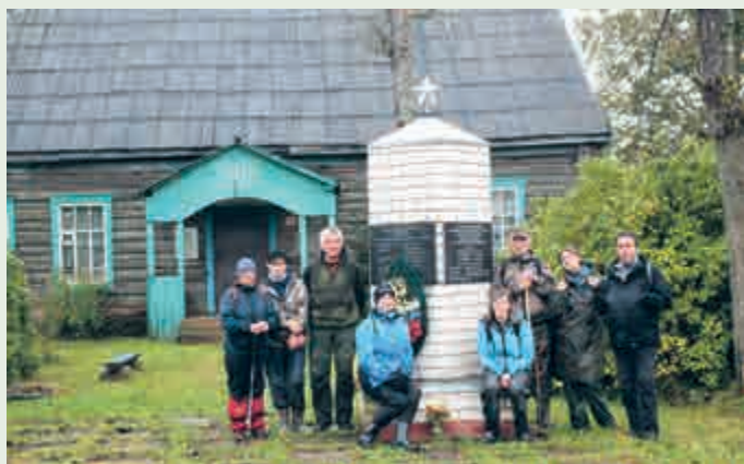
Памятный знак в деревне Корево