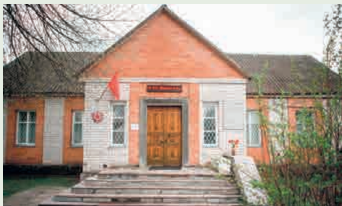
Музей партизанской славы

Демидовский район становится центром северо-западного партизанского края Смоленщины, столицей которого стала маленькая деревушка Корево (бывший Слободской район), где расположился штаб будущего крупного партизанского соединения «Батя».