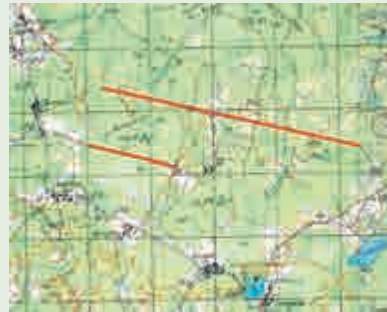
На топографической карте 1990 г. (1:100000) красным цветом выделены две лежневые дороги

данную местность: в рельефе чётко выражено понижение глубиной 2,5-3 м. с ровным дном и сильно переувлажнёнными почвами. Растительность характерна для верховых и низинных болот, встречаются заросли осоки, тростника. Обычная палка легко «уходит» на глубину до 40 см., возраст древесной растительности на «дне» бывшего водоёма не превышает 50 лет. По словам участника экспедиции, биолога