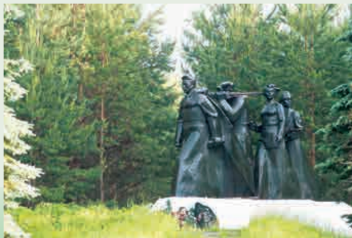
Памятник партизанам Смоленщины. Посёлок Пржевальское

Пусть же память о народных мстителях будет вечной!