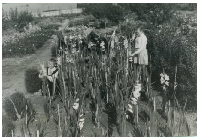
Опыты с гладиолусами.

Большое внимание в работе кружков отводилось привлечению юннатов к навыкам научной работы, а именно, проведению по разным направлениям опытов. В процессе опытнической работы изучались способы стратификации семян яблонь, способы заготовки и хранения черенков яблонь для последующих прививок, способы заготовки, хранения и высадки в грунт черенков черной смородины для последующего выращивания качественных саженцев. Юные садоводы изучали влияние различных способов прививок в климатических условиях нашей области. В яблоневом саду проводились опыты по изучению внекорневых подкормок различными дозами минеральных удобрений на развитие и урожайность яблонь. Опыты по сортоизучению яблонь, по изучению биологических и механических способов борьбы с насекомыми – вредителями сада. Все опыты проводились по заданию Центральной станции юных натуралистов, областного управления сельского хозяйства и областной станции защиты растений. Много опытов проводилось и по цветоводству. В процессе опытнической работы юннаты овладевали простейшими навыками исследовательской работы: вели фенологические наблюдения, анализировали результаты, по всем опытам велись дневники.